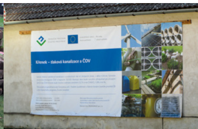
Křenek, kanalizace a ČOV