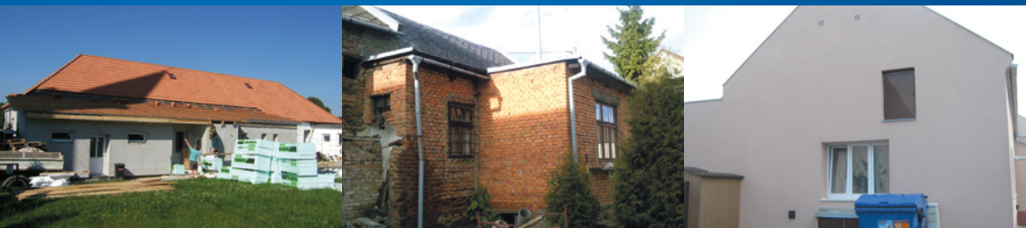
Bořenovice u Holešova, společenský dům