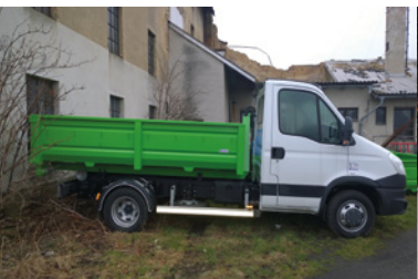
Sány, svoz biomasy