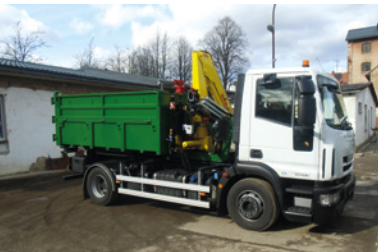
Březnice, svoz biomasy