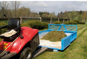
Kořenov, svoz biomasy