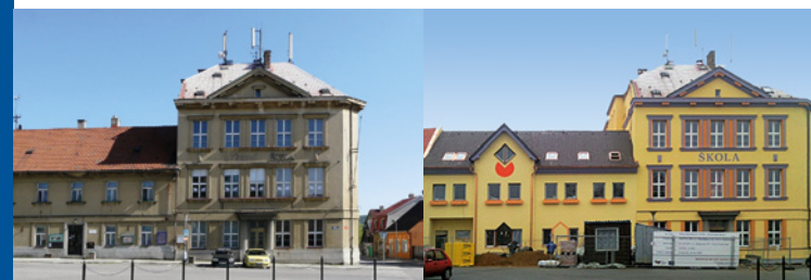
Základní škola Dolní Bousov